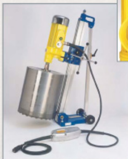
TH-25 / TH-40